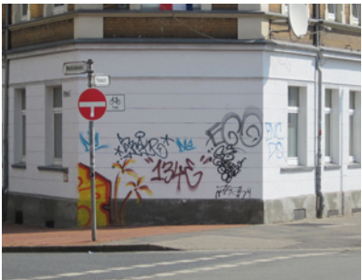
Beispiel einer Hauswand vor und nach der Instandsetzung und Anlagenmontage